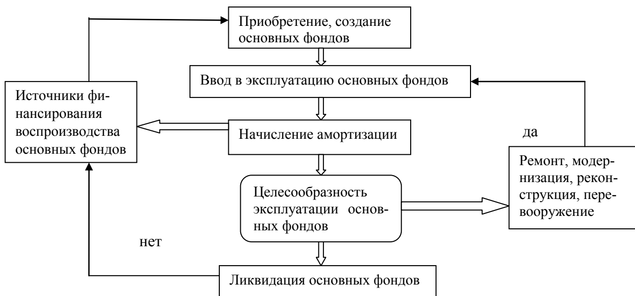
Рисунок 2 - Алгоритм воспроизводства основных фондов

выпускаемой продукции с учетом степени физического и морального износа оборудования». Форма воспроизводства основных фондов выбирается руководством предприятия на основании критерия максимизации получаемой прибыли от использования рассматриваемого оборудования. В тех случаях когда максимальная прибыль ожидается от ремонта основных фондов, их реконструкции или модернизации, считается целесообразным продолжить их дальнейшую эксплуатацию. Если более выгодным признается замена оборудования на новое, руководством предприятия принимается решение о ликвидации (продаже) используемого оборудования, определяются источники финансирования воспроизводства, приобретается новое оборудование. В итоге схема воспроизводства основных фондов приобретает следующий вид (рис.2).