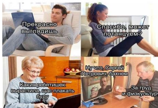
Рис.2–Мем, описывающий выпускной

Примерно так будет выглядеть выпускной у 11-классников в 2020