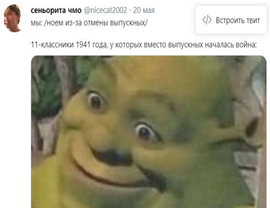
Рис.5–Мем, в котором косвенно используется сравнение

Если говорить о том, какая проблема высмеивается в мемах чаще всего, то это экзамены — на них приходится 53 % от общего количества рассматриваемых картинок. Тема ЕГЭ и ОГЭ популярна, поскольку для выпускников это самое важное, от их баллов зависит вуз, в который они поступят. Реже встречаются мемы о последнем звонке (10 %). 18 % мемов отражают проблемы выпускного вечера. Высмеивается отсутствие пособия у 11-