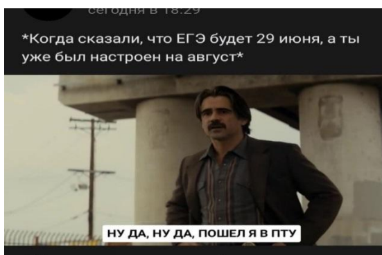
Рис.3–Мем, содержащий новость о переносе ЕГЭ

Мемы не только информируют школьников, но и предлагают нестандартные решения проблемы с выпускным, например,