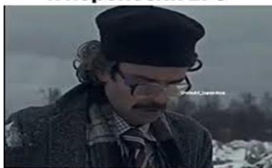
Рис.7–Мем, начинающийся с «когда» и выражающий эмоциональное состояние

В современном мире нецензурные выражения в мемах — частое явление. В ходе анализа 100 мемов, относящихся к теме выпускников 2020 года, было замечено, что мат присутствует всего в 6 % случаях. Это говорит о том, что модераторы групп