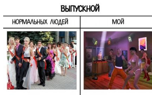
Рис.6–Мем из серии «ожидание-реальность»

В современном мире нецензурные выражения в мемах — частое явление. В ходе анализа 100 мемов, относящихся к теме выпускников 2020 года, было замечено, что мат присутствует всего в 6 % случаях. Это говорит о том, что модераторы групп