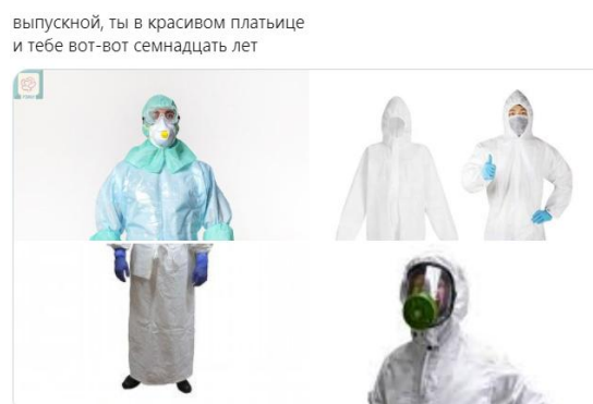
Рис.4–Мем, использующий преувеличение

надеть противогазы (5 %) или специальные костюмы (6%), чтобы сходить очно на последний звонок.